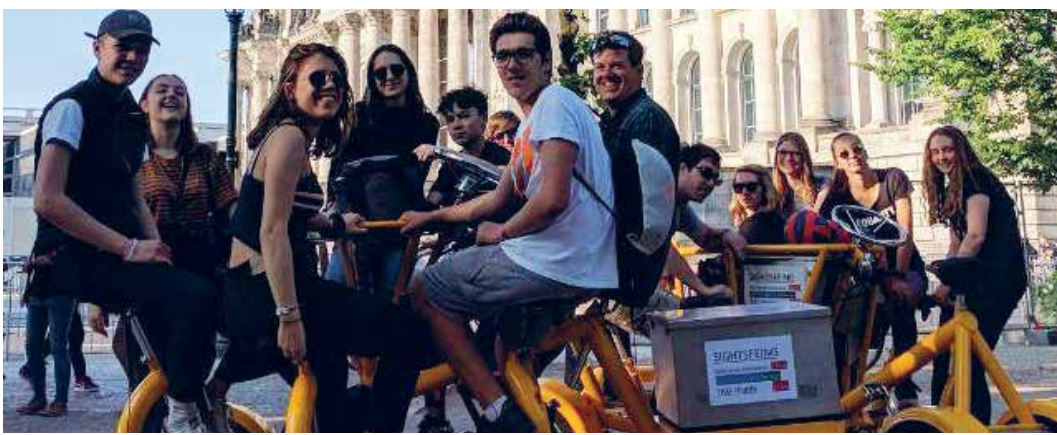
Auf dem funbike vorm Brandenburger Tor

Informationsabend Pfefferstern, Montag, 3. September, 19.00 Uhr, Ref. Kirchgemeindezentrum Leimbach, Jugendraum