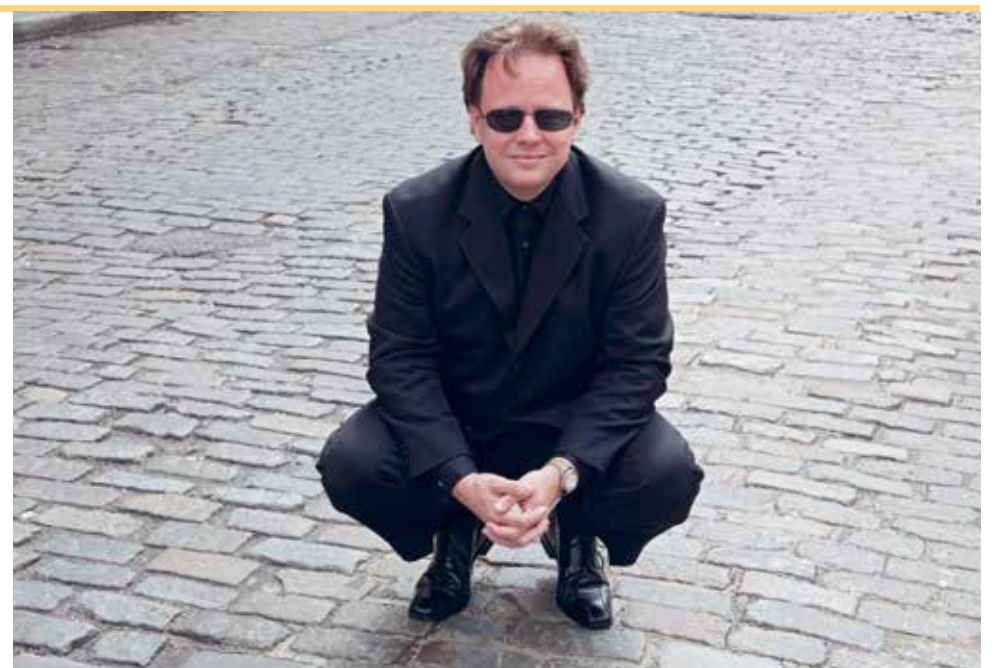
Konzertorganist und Improvisator aus New York