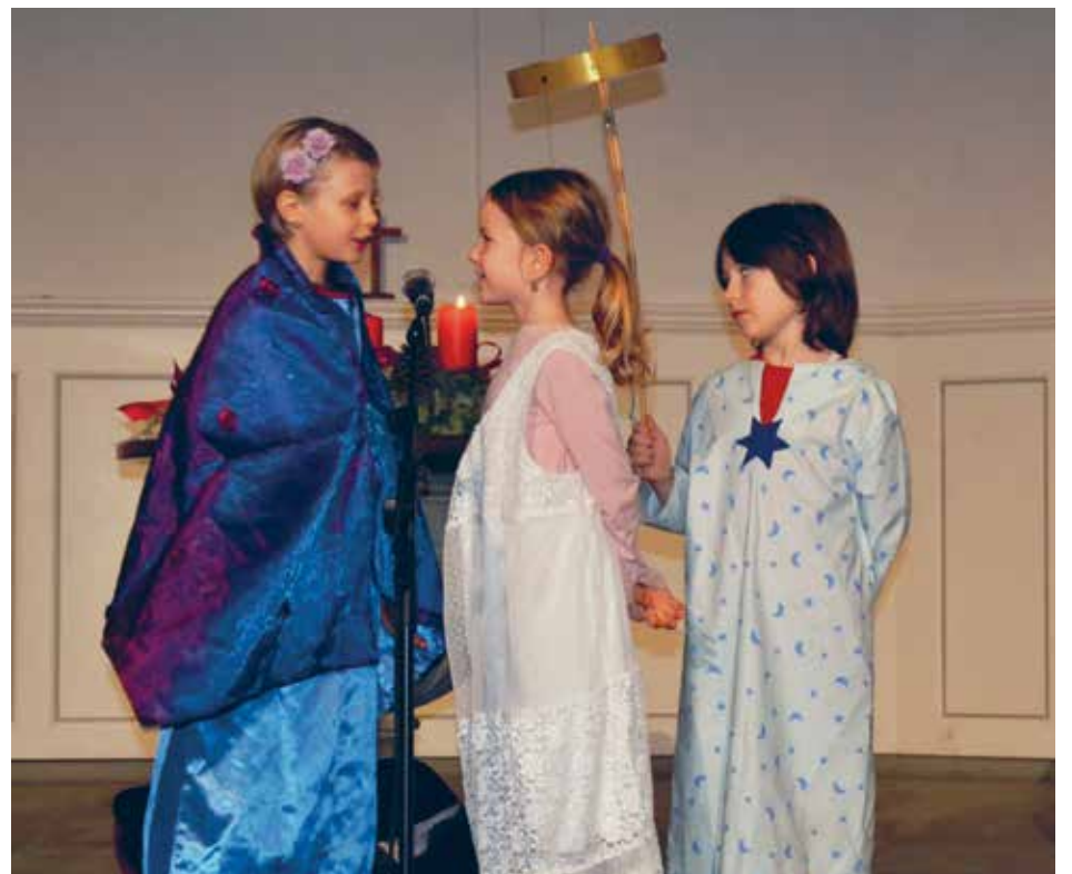
Impressionen vom letzten Jahr

Samstag, 15. Dezember 2018, 16.30 Uhr, Alte Kirche Wollishofen